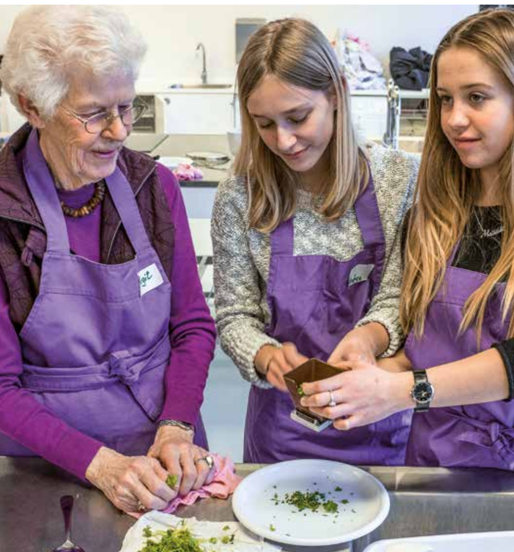
I "Mad i generationer"-projektet laver ældre og unge mad sammen.

Jeg ser frem til et konstruktivt samarbejde om at udvikle en sammenhængende skole. Trivsel og læring går hånd i hånd, og derfor er jeg stolt over, at vi i 2021 igen nåede vores politiske mål om,