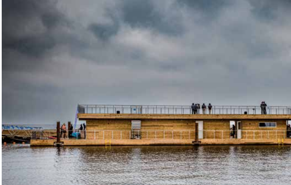
Vallensbæks borgere har taget den nye badeanstalt Valhal til sig.

Vallensbæk skal være et godt sted at bo, og derfor skal der være boliger, som afspejler behovet i alle aldre og livssituationer. Der er en række nye boligområder på vej, og jeg glæder mig til at byde