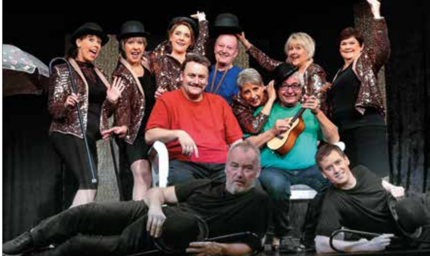
Billede fra en af teatrets tidligere forestillinger, "Svend, Knud og Valdemar".

Del dine billeder med os på Instagram Tag dem med #vallensbaeknu