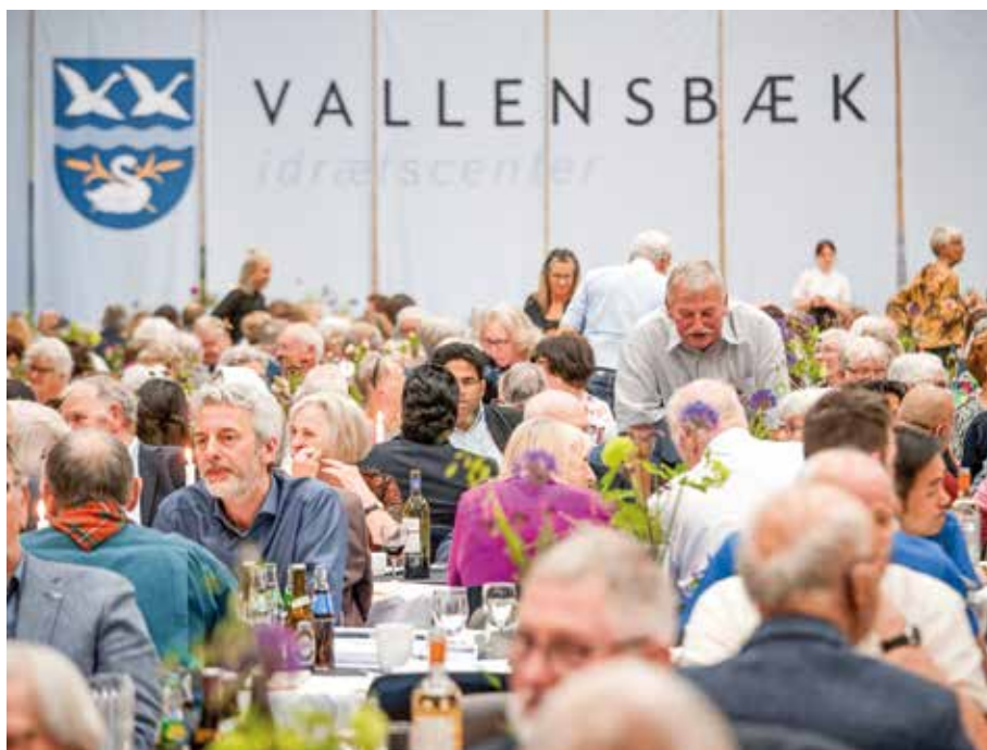
Vallensbæks frivillige og foreninger bliver hvert år fejret.