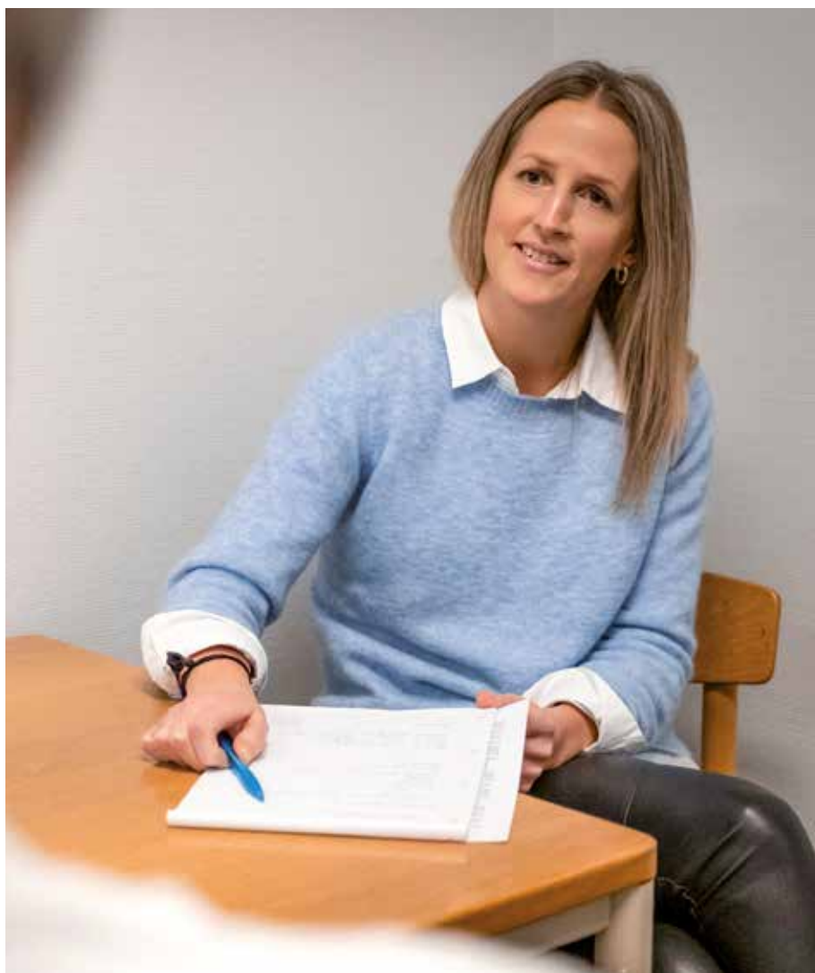
Opstarts-samtalen kan foregå fysisk eller online

med Vallensbæk Rideakademi eller sjipling med Vallensbæk Gymnastikforening. Læs mere på www.vallensbaek.dk/aktivvinterferie