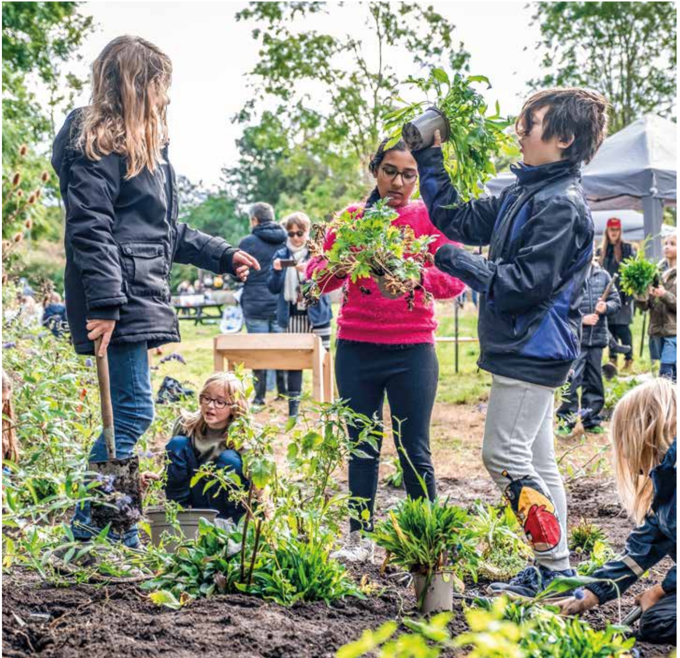
Den nye biodiversitetspark ved naturskolen Bækkehuset har bi-venlige bede, kvasbunker og insekthotel – alt sammen til gavn for dyrelivet.

at vores skoler skal være blandt de 25 procent bedste i landet.