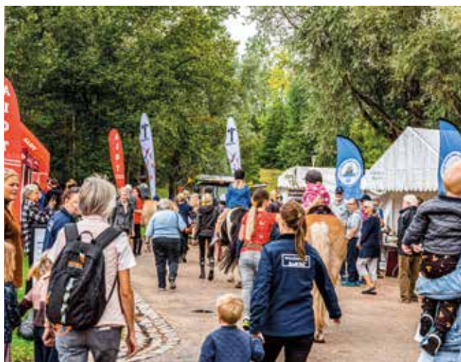
Mosens Dag sidste år.